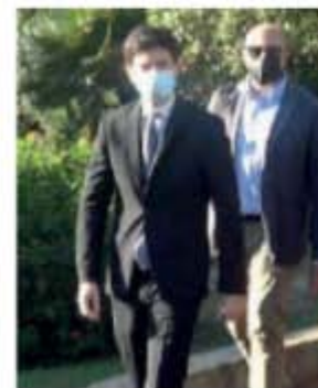
Speranza a Villasimius

Inchiesta. Mullah Krekar a Badu 'e Carros